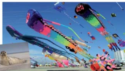
Les Cerfs Volants à Berck sur Mer