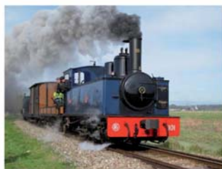
Chemin de Fer de la Baie de Somme 03 22 26 96 96